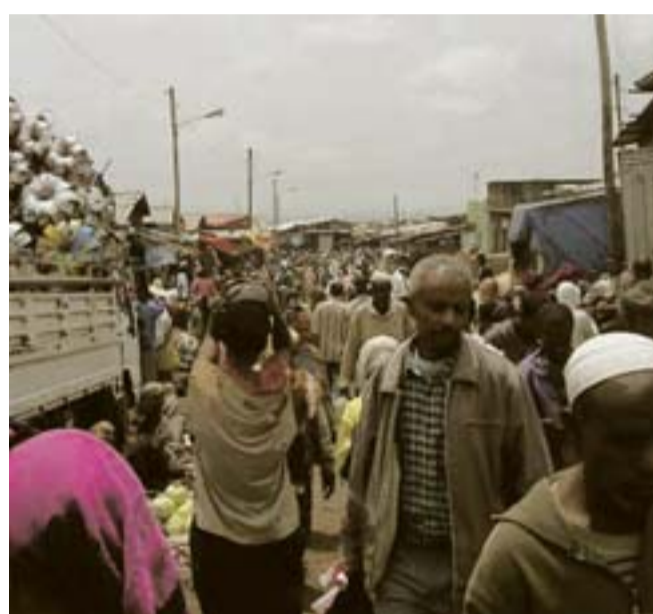
Uno scorcio del mercato di Addis Abeba: è il più grande dell'Africa

«Vero. Non c'è sviluppo rurale senza strade, elettricità, scuole, acqua pulita, sanità. Ora stiamo puntando ad una strada che ci colleghi sia col Sudan che con il Kenya. Nei prossimi tre anni verrà adeguata la ferrovia che collega Addis Abeba a Gibuti; a questo proposito