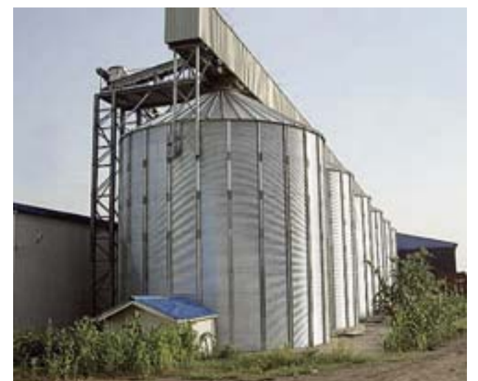
I sei silos costruiti a Nazret: ciascuno lavora 10 mila quintali di legumi