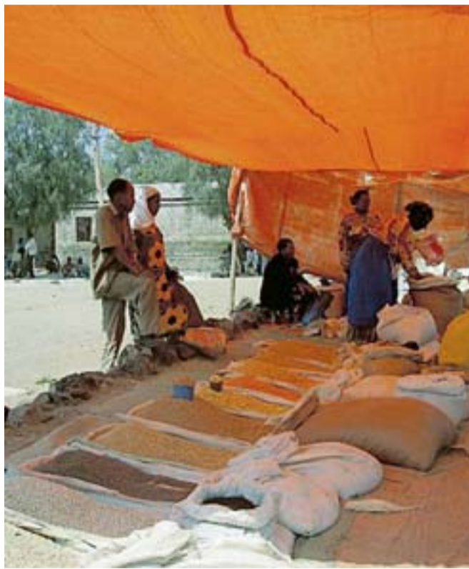
Stato di Oromia: il grande mercato che si sviluppa nel centro di Ziwai