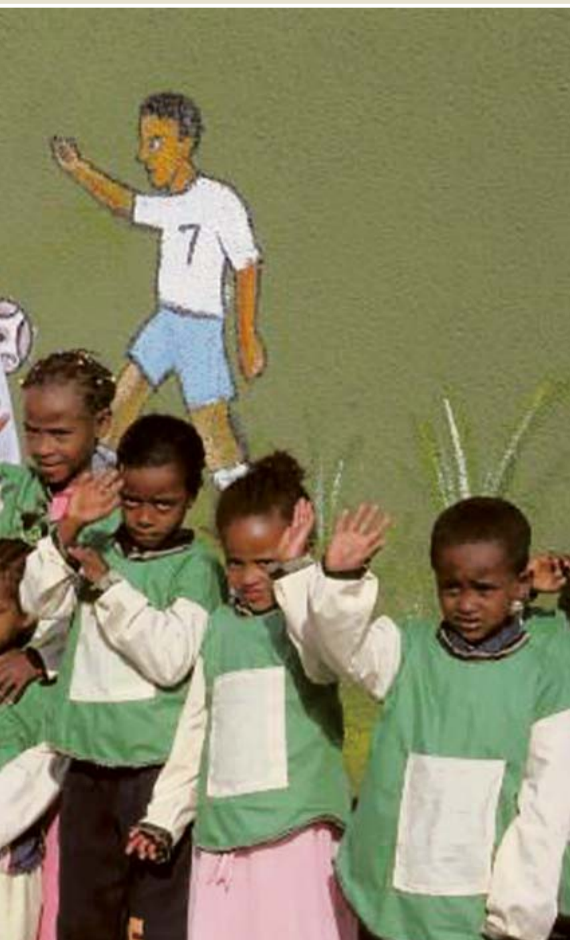
dis Abeba. È l'unico esempio di sviluppo sociale importato nello stato di Oromia, il più grande dell'Etiopia.

L'INTERVISTA. A colloquio col Ministro dell'Agricoltura