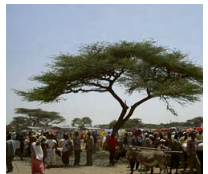
Uno scorcio dei panorami che circondano la città di Nazret, in Oromia